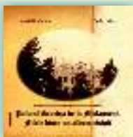
Palatul Sturdza de la Miclăușeni. File dintr-un album risipit Narcis Dorin Ion, Sorin Iftimi