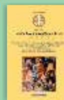
Scrieri V. Tâlcuire la canoanele celor douăsprezece praznice împărătești Sfântul Neofit Zăvorâțul din Cipru