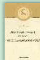
Omilii la Maica Domnului Sfântul Neofit Zăvorâțul din Cipru