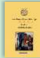
Scrieri II. Cateheze. Testamentul tipiconal Sfântul Neofit Zăvorâțul din Cipru