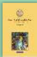
Scrieri III. Panegirice Sfântul Neofit Zăvorâțul din Cipru