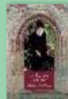
Sfântul Paisie Aghioritul