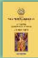
Scrieri I. Zece cuvinte despre poruncile lui Hristos. Cincizeci de capete Sfântul Neofit Zăvorâțul din Cipru