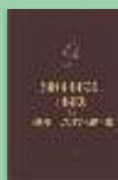
Sinaxarul Mare al lunii octombrie