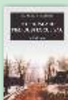
Totul își are timpul și locul său. Scrieri alese Pr. Mihail Pomazanski