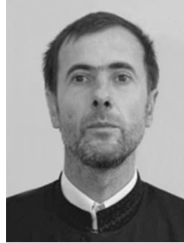
Pr. Iulian Moisiu

se infiltrează aproape insesizabil, păstrând în aparență imaginea unei bune credințe. În realitate, se ajunge la un creștinism fără Hristos, bine acomodat la lumea aceasta, însă neputincios în a oferi omului izbăvirea din stricăciune și moarte”.