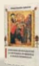
Canoane de rugăciune la Intrarea în Biserică a Maicii Domnului Sfântul Nicodim Aghioritul Traducere: Monahia Parascheva Enache Ediție îngrijită de: Claudiu-George Dulgheru