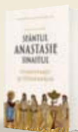
Scrieri I. Comentariu la Hexaemeron Sfântul Anastasie Sinaitul Traducere: Monahia Parascheva Enache Ediție îngrijită de: Pr. Dragoș Bahrim