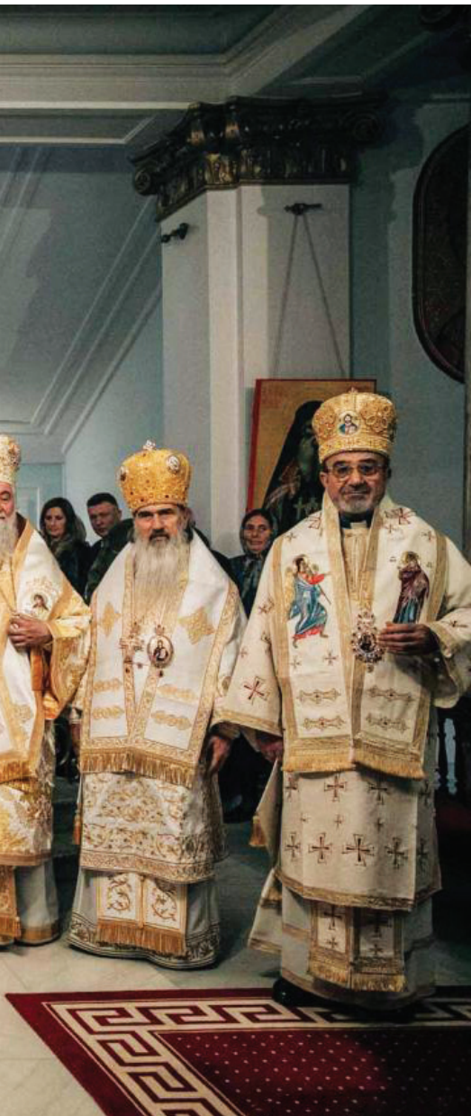
troparul Cuvioasei și al Sfântului Andrei Criteanul.