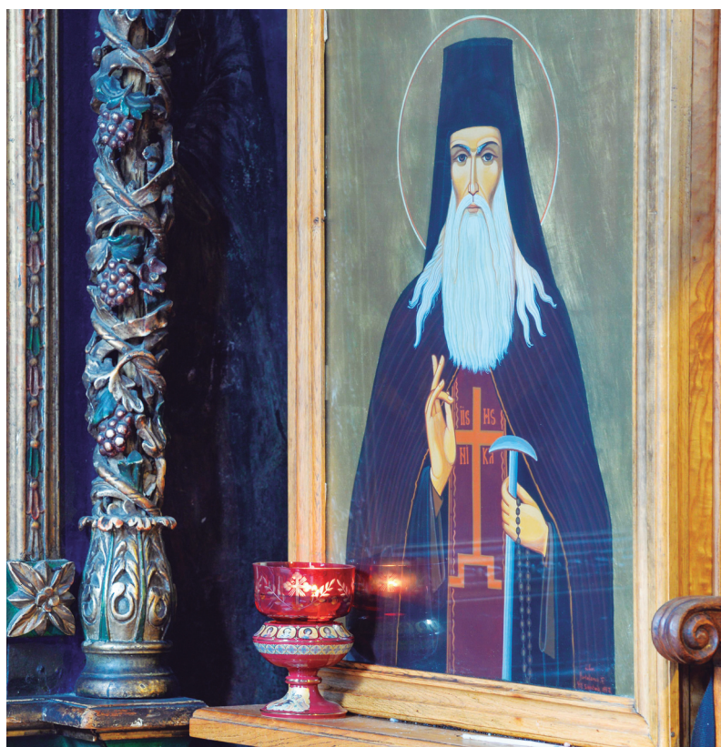
Icoana Sfântului Cuvios Paisie de la Neamț (Mănăstirea Neamț)

Înaltpreasfinția Voastră, ați pomenit despre Sfântul Paisie Velicicovski care este un reper în spațiul românesc, și acum, ca ardelean, pentru că știu că sunteți ardelean și Înaltpreasfinția Voastră, aș vrea să vă întreb ceva mai personal: cum credeți că a contribuit monahismul din spațiul transilvan la crearea unei spiritualități isihaste până la 1700? Părintele Stăniloae vorbește la un moment dat și despre aspectul acesta și, din ⇒