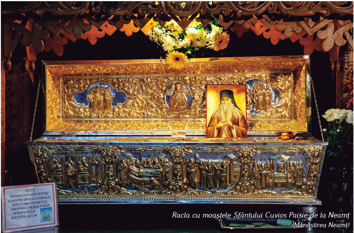
Racla cu moaștele Sfântului Cuvios Paisie de la Neamț (Mănăstirea Neamț)

⇒ Avem pe Sfântul Simeon Noul Teolog în secolul al X-lea și al XI-lea, care vorbește foarte clar despre experiența harului în viața creștinului.