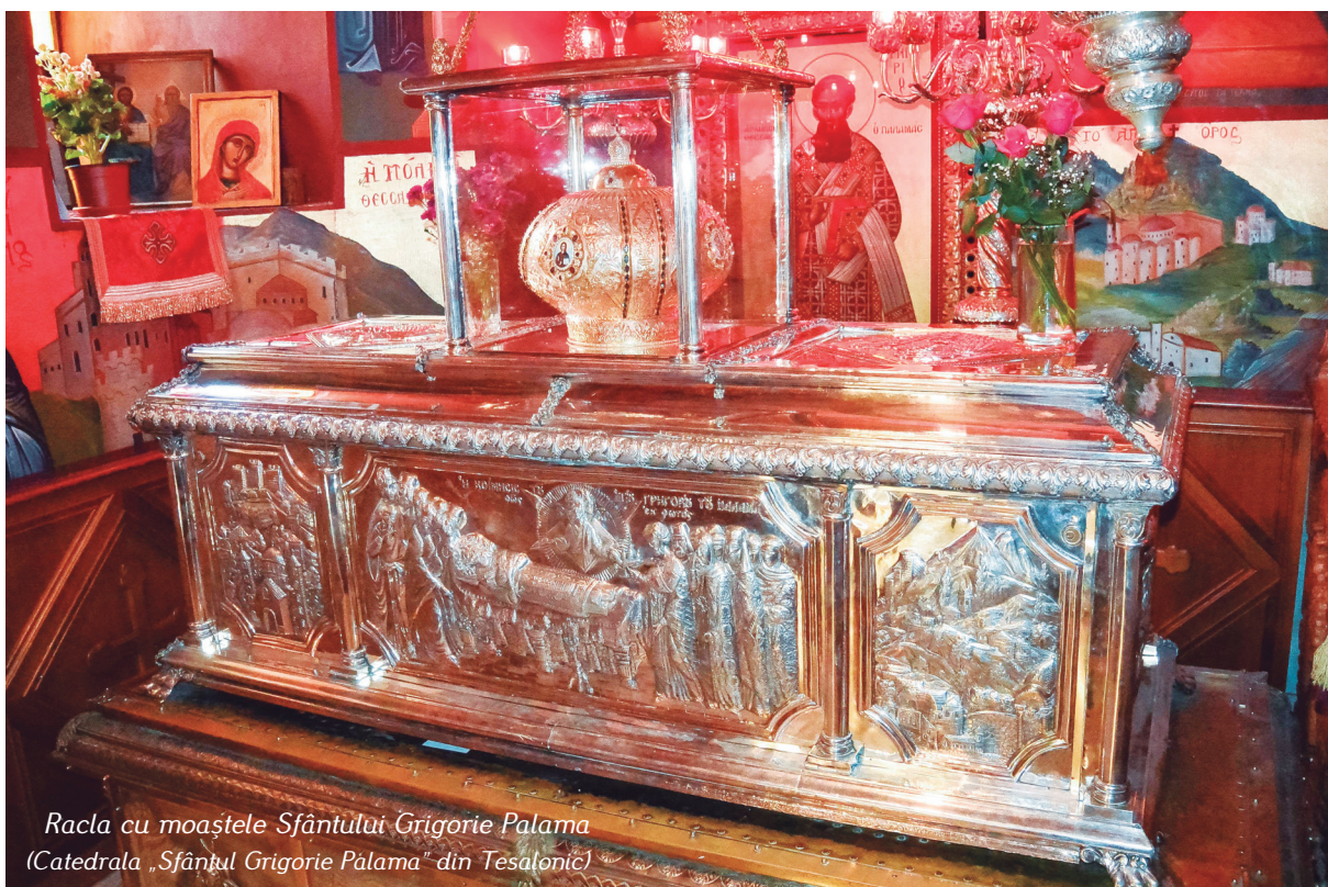
Racla cu moaștele Sfântului Grigorie Palama (Catedrala „Sfântul Grigorie Palama” din Tesalonica)

Noi avem în limba română cuvântul de sihastru. Sihaștrii sunt călugării care s-au retras din obștile ➡